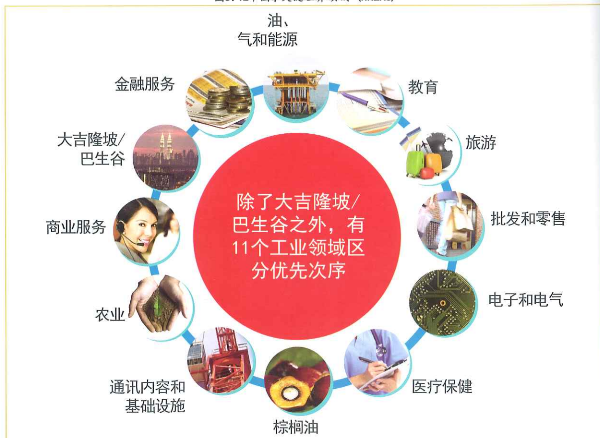
图5: 12个国家关键经济领域（NKEAs）

总共有13个自由贸易协议（FTAs）已议定，即8个区域和5个双边自由贸易协议（见表3）。区域自由贸易协议有东盟自由贸易区（AFTA）（于1992年1月28日签署）、东盟-中国（于2004年11月29日签署）、东盟-韩国（于2006年8月26日签署）、东盟-日本全面经济伙伴关系（AJCEP）（于2008年4月14日签署）、东盟-印度（货物）（于2009年8月13日签署）、东盟-澳大利亚-新西兰（于2009年2月27日签署）、贸易优惠系统（TPS）-伊斯兰会议组织（于2004年6月30日签署）和 D-8 优惠贸易协议（PTA）（于2005年签署）。双边自由贸易协议有马来西亚-日本经济伙伴关系协议（MJEPA）（于2006年7月13日生效），马来西亚-巴基斯坦全面经济伙伴关系协议（MPCEPA）（于2008年1月1日生效），马来西亚-新西兰（于2010年8月1日开始生效）、马来西亚-印度（于2011年7月1日开始生效）和马来西亚-智利（于2012年2月28日生效）。